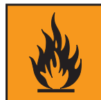
Īpaši viegli uzliesmojošs